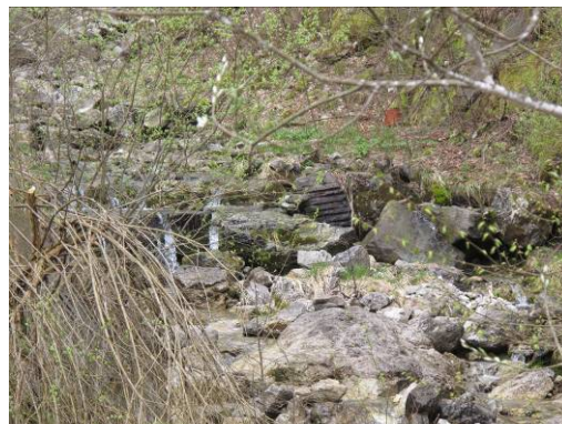
Fig 2: Soglia INF011