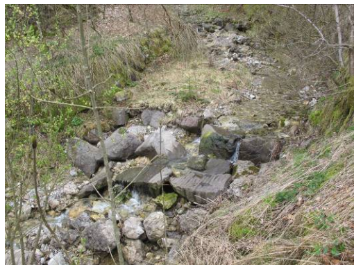
Fig 1: Soglia INF010